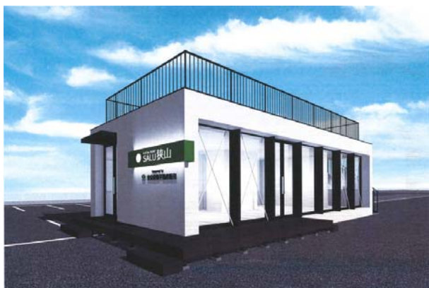
＜新クラブハウス完成イメージ＞