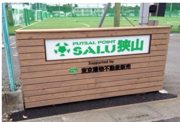
＜施設エントランスゲート＞